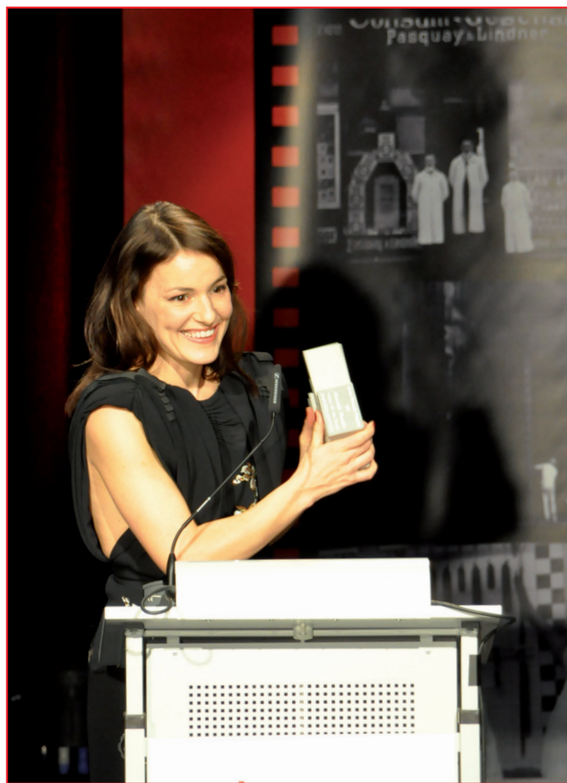
Beste Darstellerin: Nicolette Krebitz

Preise für Christoph Hochhäusler, Nicolette Krebitz und Anna Loos