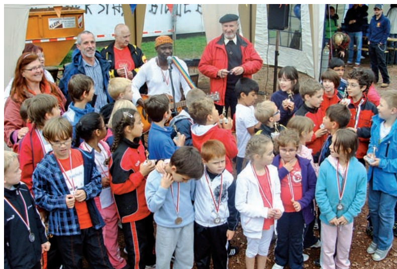
Siegerehrung beim Weltkindertag