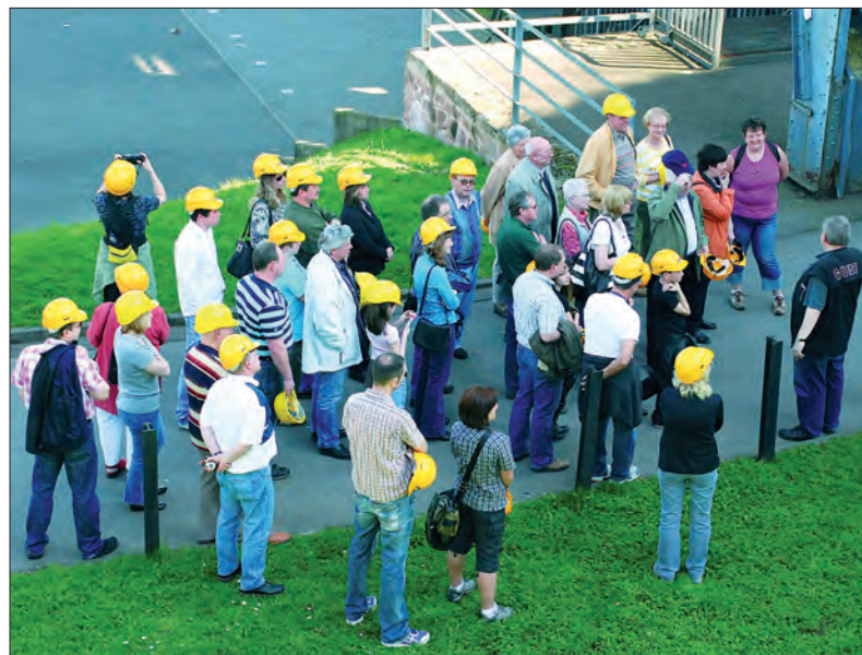
Aufmerksame Zuhörer bei der Hüttenwegsführung

Mehr Infos gibt es im Rathaus unter Tel. (06821) 202-122, -325. Hier ist auch die Hüttenwegsbroschüre erhältlich, die es ermöglicht, den Hüttenweg „auf eigene Faust“ zu erkunden.