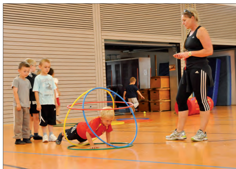
Mit Geschick zum Minisportabzeichen