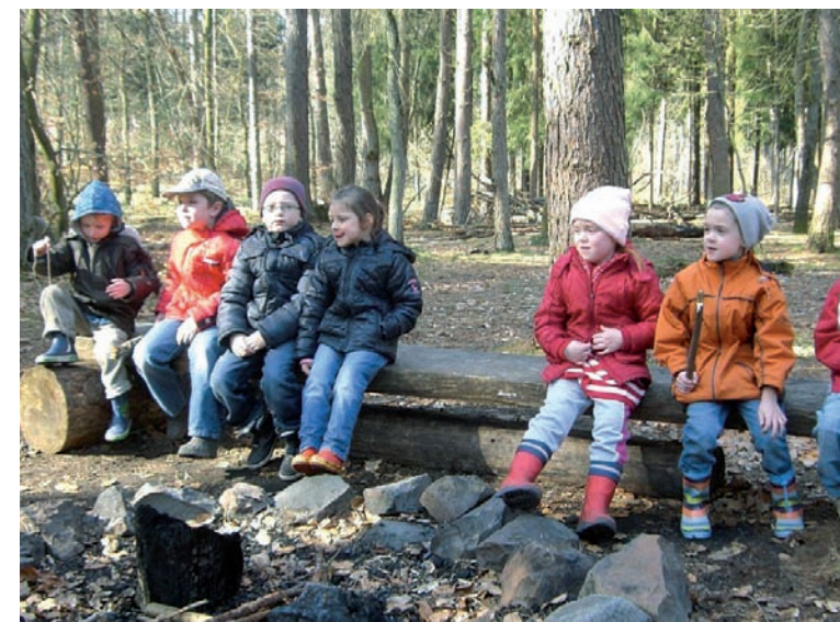
Wald-Entdecker auf Tour

denen Nadelbäume und Herbstblätter der Laubbäume zusammen. „Es ist wichtig, bereits den ganz Kleinen ihre Umwelt näher zu bringen. Spielerisch lernen die Kinder die Tiere und Pflanzen kennen. Das Waldprojekt ist wirklich eine tolle Sache. Zusätzlich interessieren sich die Kinder auch für die Forstwirtschaft. Warum werden Bäume gefällt und was passiert mit ihnen? Wozu brauchen wir das Holz? Das sind Fragen, die die Kinder beschäftigen. Und rennen und toben kommt auch nicht zu kurz“ meint Fries-Kunz. Die Kinder und ihre Erzieherinnen waren sich einig: Sie wollen bald wieder in den Wald.