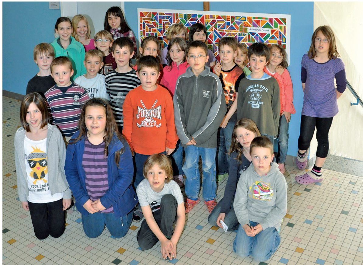
Stolze junge Künstler in Furpach

Auch die Kinder präsentieren voller Stolz ihre selbstgemalten Plättchen als Teil des Ganzen.