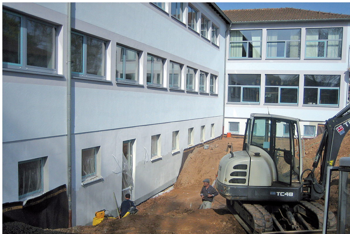
Sanierungsarbeiten an der Grundschule in Wellesweiler

Im Rahmen der Schulhofumgestaltung wird auch das Erscheinungsbild des überdachten Pausengangs zwischen der Erweiterten Realschule und der Grundschule verbessert. Neben einem neuen Deckenanstrich wird ein Stahlgelenker die defekten Glasscheiben und Holzelemente ersetzen. Für die Schulhofumgestaltung stehen insgesamt 50.000 € zur Verfügung. Oberbürgermeister Jürgen Fried sieht dies positiv für das Lernumfeld der Kinder: „Wer sich wohlfühlt, lernt leichter.“