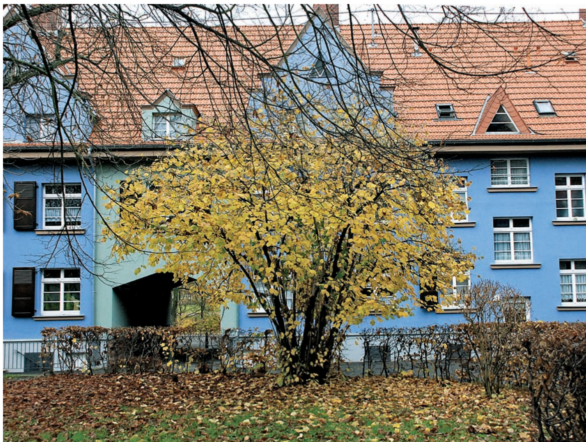
Stadtmomente: Bunte Herbstimpressionen am Bliesblock

Die Lohnsteuerkarte für 2011 wurde erstmalig nicht mehr von den Gemeinden im Oktober versandt. Vielmehr wird die Lohnsteuerkarte durch ein elektronisches Verfahren ersetzt. Dieses Verfahren wird jedoch erst in 2012 vollumfänglich umgesetzt sein. Aus diesem Grund wird ausnahmsweise für 2011 die Lohnsteuerkarte 2010 mit allen Eintragungen weiter gelten. Der Arbeitgeber kann also die Lohnsteuer ab Januar 2011 nach den Merkmalen, die der ihm vorliegenden Lohnsteuerkarte 2010 zu entnehmen sind, einbehalten. Sollten diese für 2011 unzutreffend sein, kann auf der Lohnsteuerkarte 2010 auf Antrag eine Änderung vorgenommen werden. Wichtig hierbei ist jedoch, dass alle Anträge auf Änderung nunmehr bei dem Finanzamt (Wohnsitzfinanzamt) zu beantragen sind. Die Gemeindebehörden sind für Eintragungen/Änderungen auf der Lohnsteuerkarte nicht mehr zuständig. Infos sind unter www.saarland.de bzw. www.elster.de abrufbar.