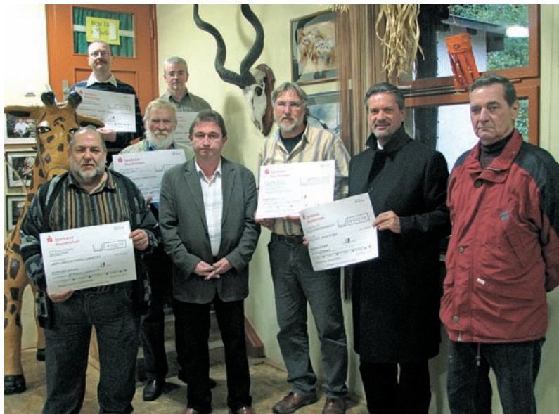
Geldsegen für den guten Zweck