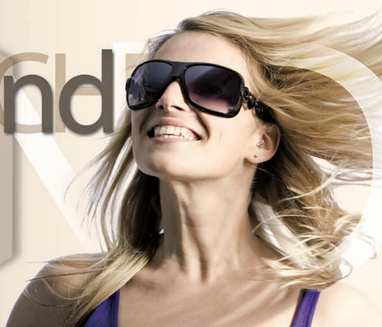
Motiv: Agentur k' meo