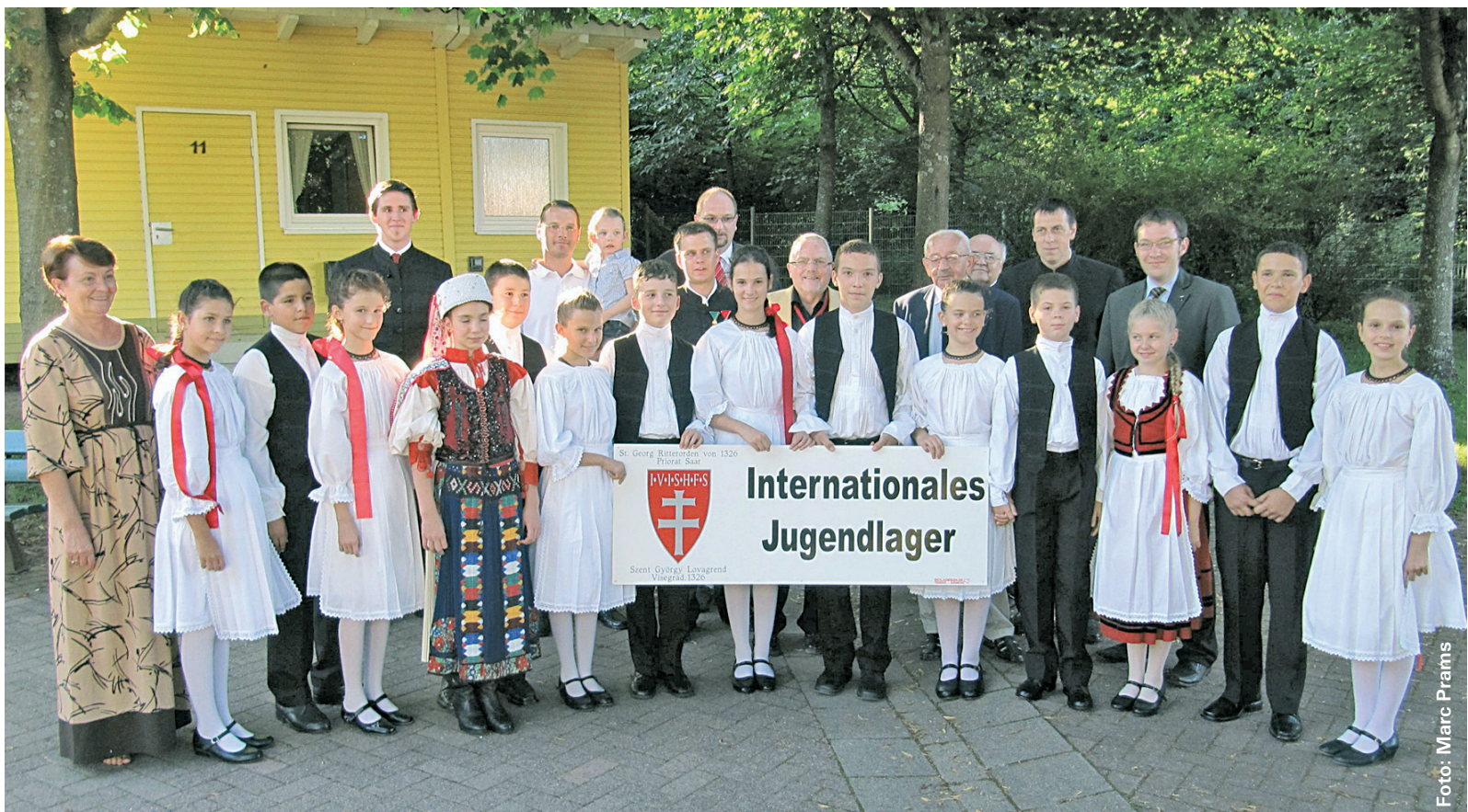
Die Tanzgruppe Boroka aus Rumänien begeisterte an der Eröffnungsfeier, das internationale Jugendlager ist noch bis Samstag in Neunkirchen zu Gast.