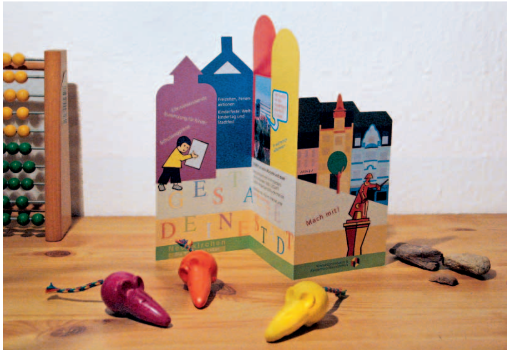
In besonderer Form: der neue Kinderflyer der Stadt.

Im Bereich der Schulwegsicherung wird in diesem Jahr der Schulwegplan für die Grundschule Bachstraße neu erarbeitet. ■