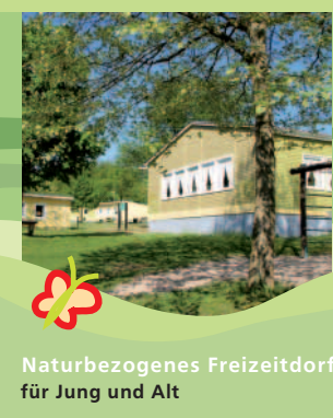
Naturbezogenes Freizeitdorf für Jung und Alt