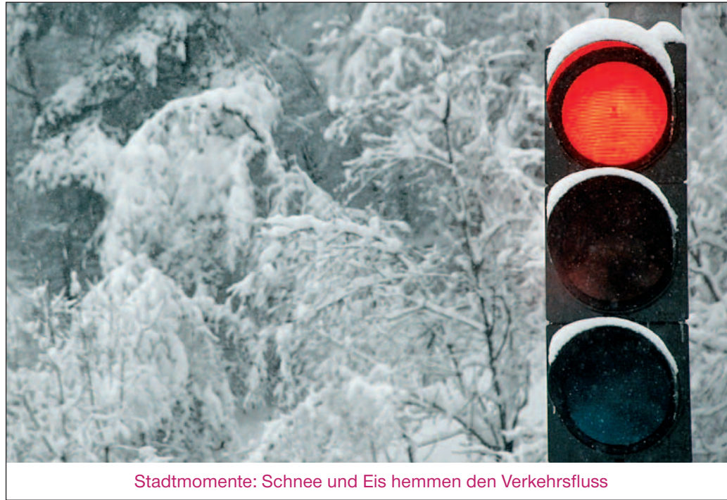
Stadtmomente: Schnee und Eis hemmen den Verkehrsfluss