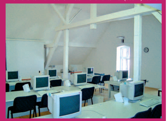
Schulungsraum EDV-Zentrum VHS Neunkirchen

Anmeldungen und Infos zu den EDV-Kursen der VHS Neunkirchen unter Tel. (06821) 290101