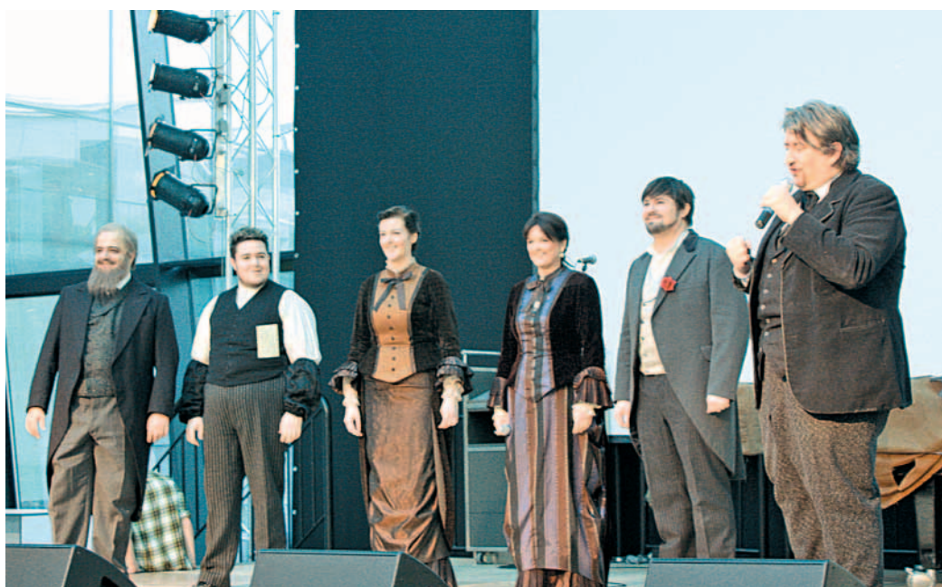
Das Musical „STUMM“ präsentierte sich auf der Stuttgarter Tourismmesse