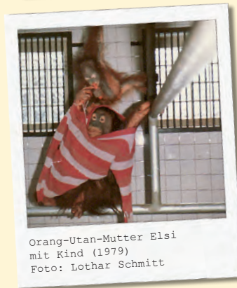
Orang-Utan-Mutter Elsi mit Kind (1979)