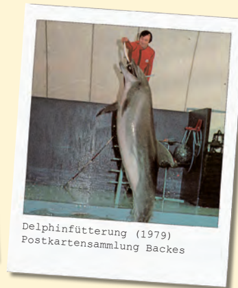
Delphinfütterung (1979)