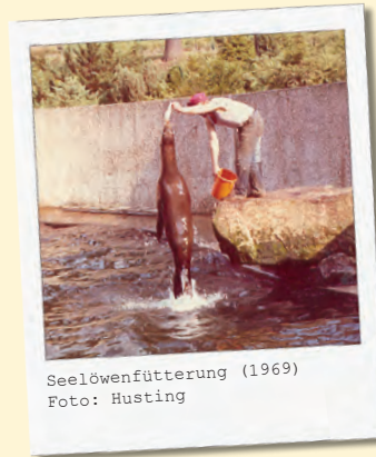
Seelöwenfütterung (1969)