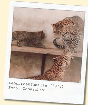
Leopardenfamilie (1973)