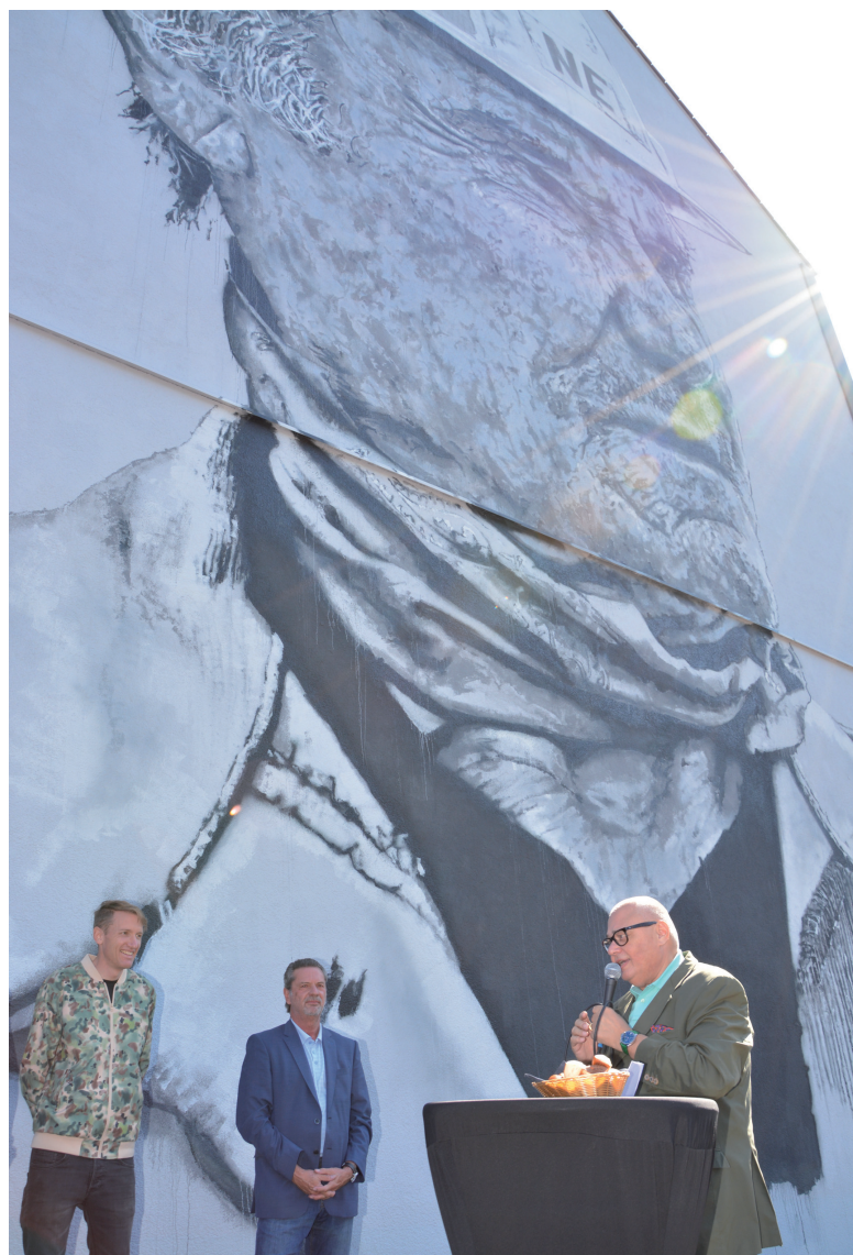
Den Künstler freut das Lob Grewenigs.