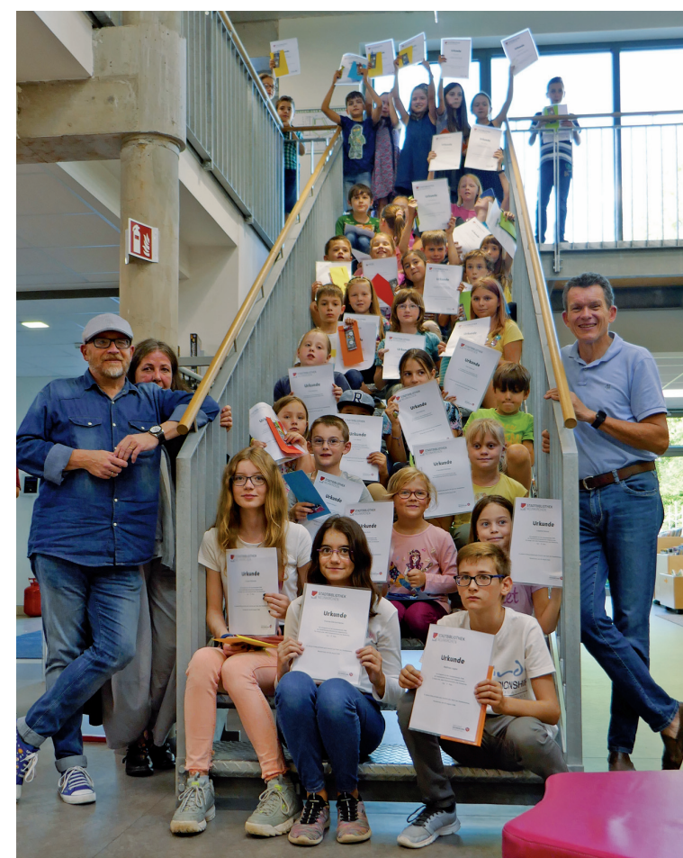
Sie alle lasen 6 Bücher oder mehr in den Ferien.