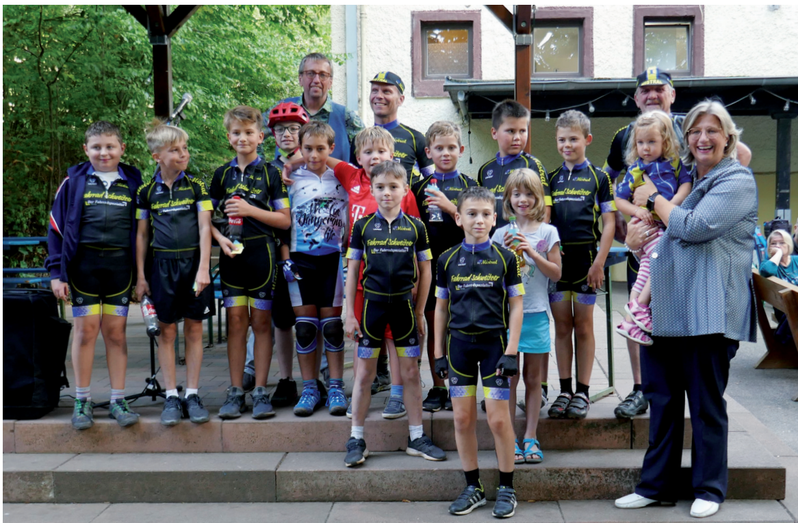
Der RC Mistral führte in der Teamwertung. Ministerin Anke Rehlinger gratulierte.

In diesem Jahr beteiligte sich die Kreisstadt Neunkirchen bereits zum vierten Mal an der deutschlandweiten Mitmach-Aktion Stadtradeln. Innerhalb des dreiwöchigen Aktionszeitraums wurden von den 219 in 14 Teams angemeldeten Neunkircher Teilnehmern insgesamt 38.840 Kilometer zurückgelegt, eine Strecke, die fast dem Erdumfang entspricht. Vermieden wurden dadurch circa 5,5 Tonnen Kohlendioxid.