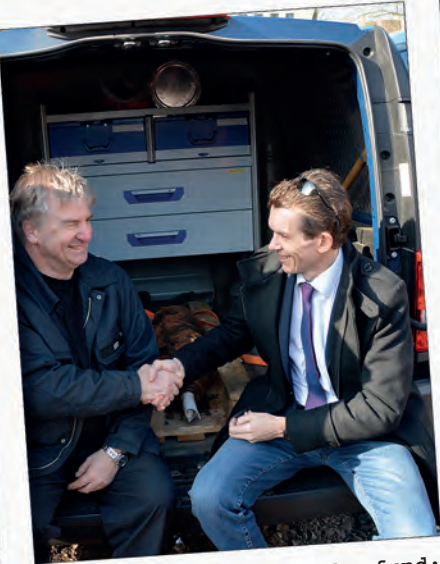
Evakuierung nach Bombenfund: Neunkirchen zieht an einem Strang