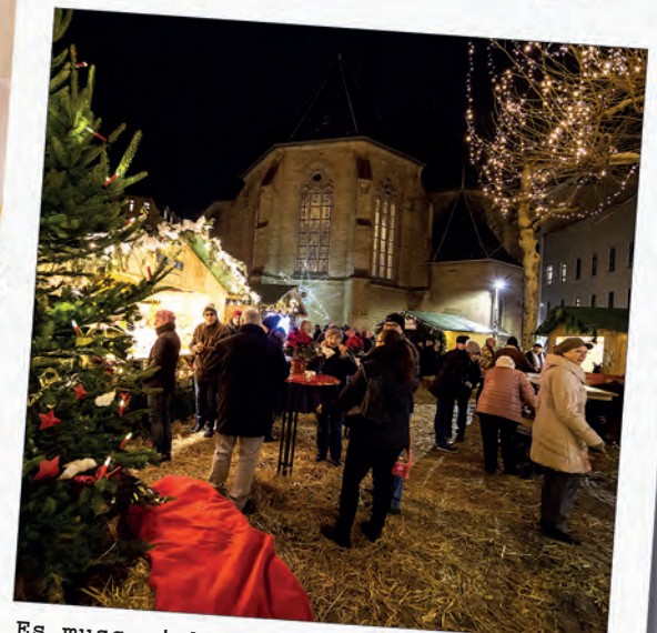
Es muss nicht immer kommerziell sein: Stimmungsvoller Weihnachtsmarkt kommt an