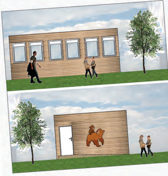
Neu und Modern: Robinsondorf wird fertiggestellt