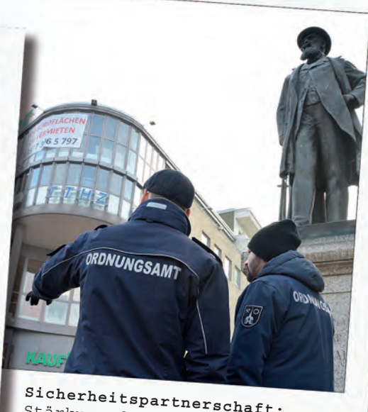
Sicherheitspartnerschaft: Stärkung der Zusammenarbeit mit Polizei und der Ordnungspartnerschaft „Bahnhof Neunkirchen“