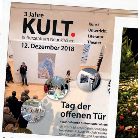
3 Jahre KULT. Kulturzentrum: „Wandel durch Kultur“ unter einem Dach