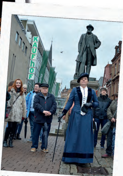
Historische Stadtführung: Weiterer Ausbau des touristischen Angebotes rund um den Neunkircher Hüttenweg