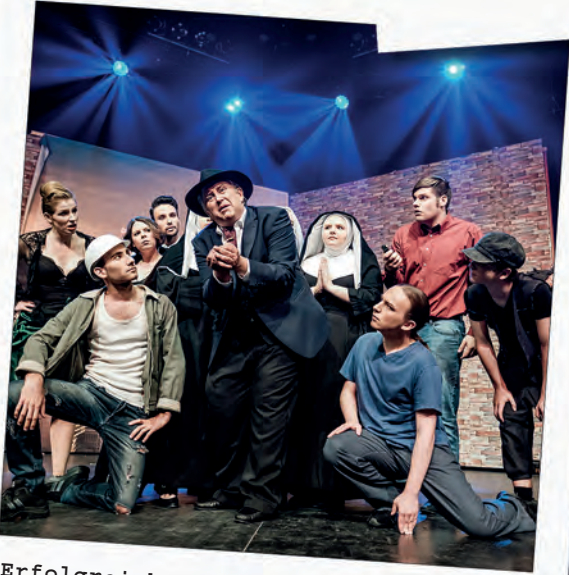
Erfolgreiche Musicalstadt mit „The Producers“ und „Die Päpstin“