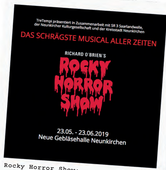
Rocky Horror Show: Spannende Neuinszenierung des Welthits