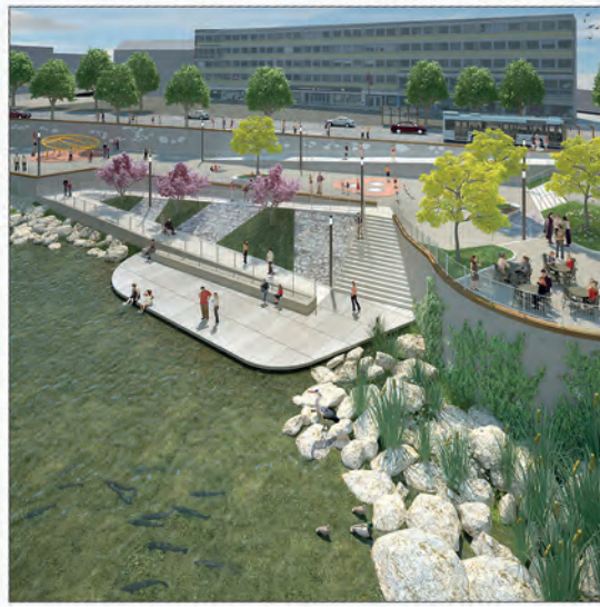
Bliesterrassen: Zweiter Bauabschnitt wird fertiggestellt