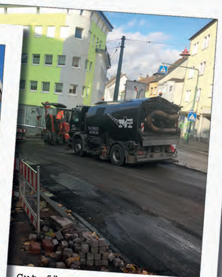
Gut für die Infrastruktur: Freie Fahrt am Hüttenberg und durch den „Pläddschedohle“