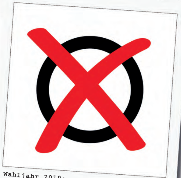
Wahljahr 2019: Europa-, Kommunal- und OB-Wahlen am 26. Mai