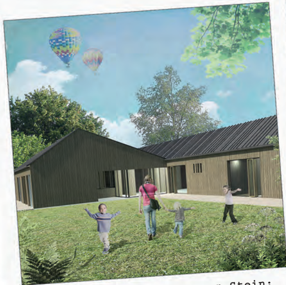
Baubeginn Kita Freiherr vom Stein: Beispiel für mehr Betreuung in Neunkirchen