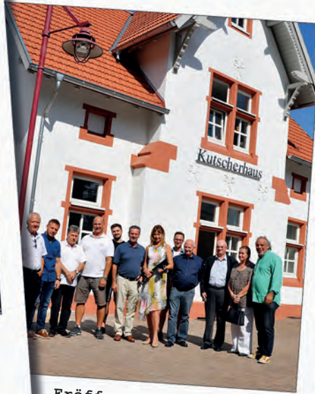
Eröffnung Kutscherhaus: Neues Kreativzentrum ist aktiv für das Quartier