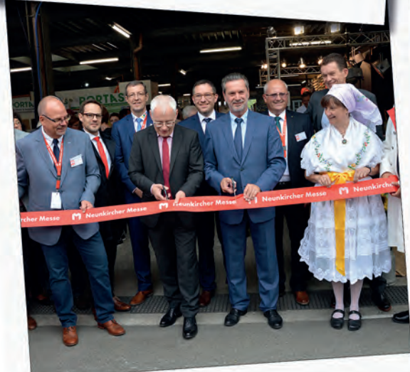
Neunkircher Messe: Erfolgreiches Forum für Handel, Handwerk und Gewerbe