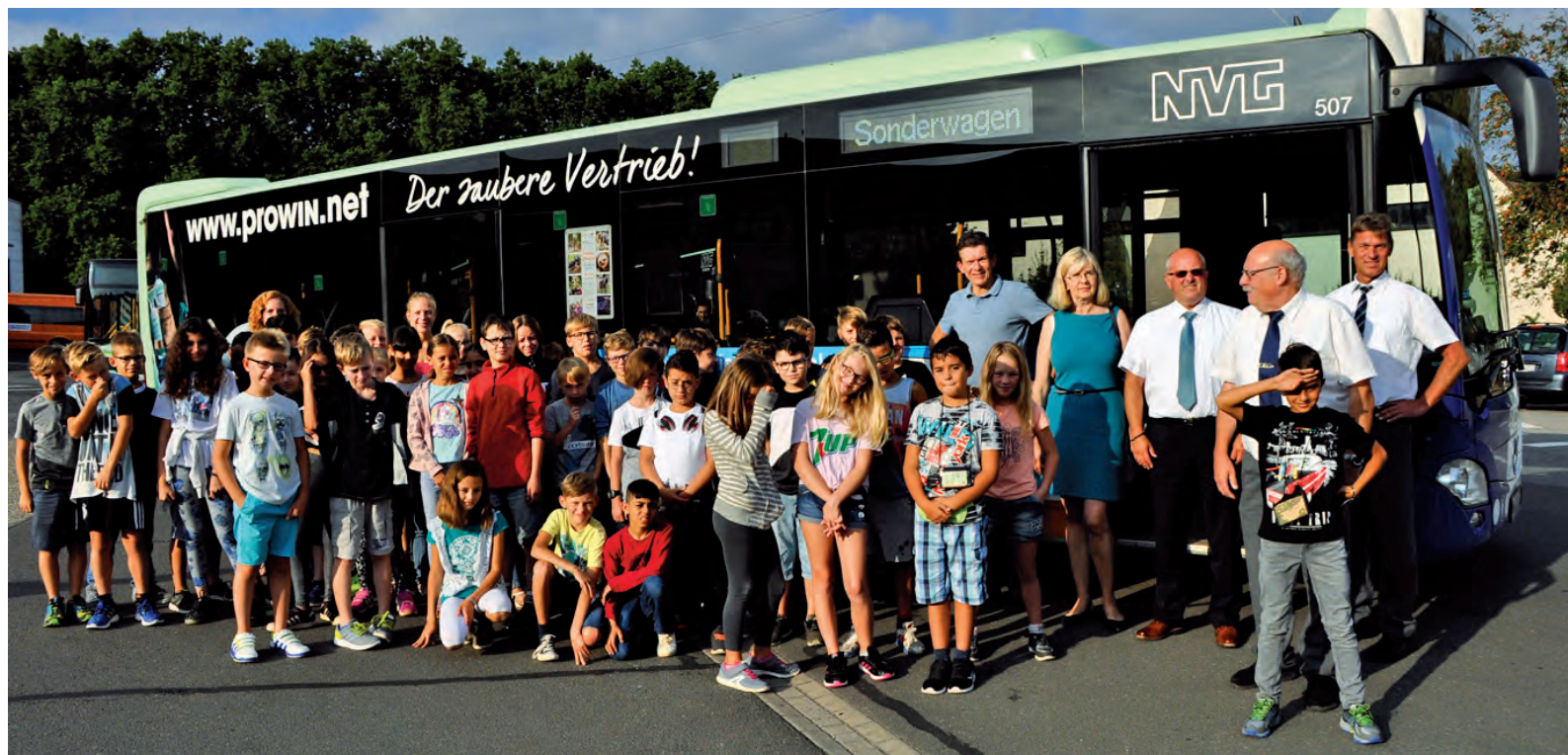
Fünftklässler werden in Neunkirchen für das ordnungsgemäße Verhalten im Busverkehr sensibilisiert.