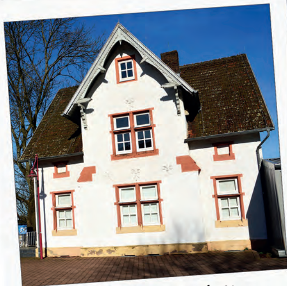
Kutscherhaus am Hammergraben: Umbau zum Kreativzentrum