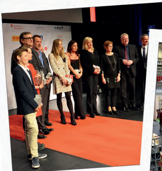
6. Günter Rohrbach Filmpreis: Namhafte Filmstars zu Gast in Neunkirchen