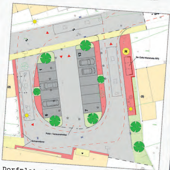
Dorfplatz Münchwies: Umbau und Anlage der Buswendeschleife