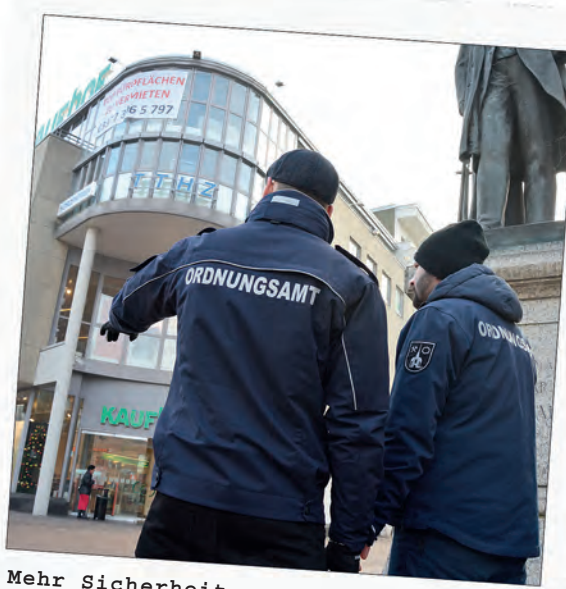
Mehr Sicherheit durch Citywache, Ordnungsdienst und Videoüberwachung