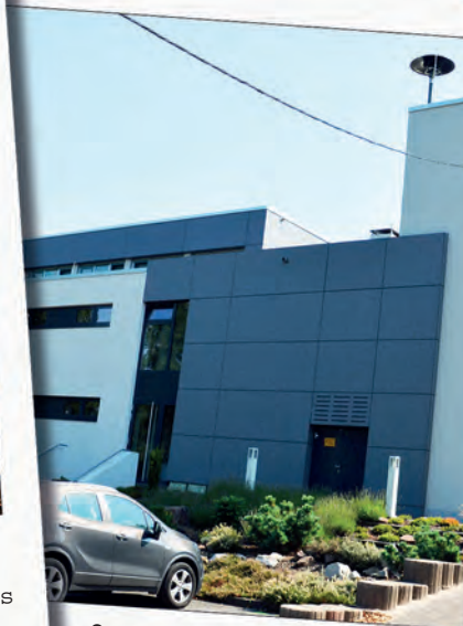
Ostertalhalle Hangard: Nach der Sanierung gute Bedingungen für die Vereine