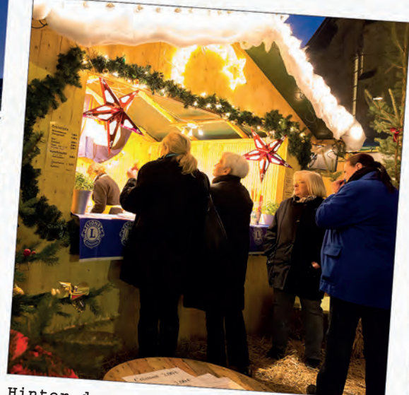
Hinter der Christuskirche: Neuer Weihnachtsmarkt am alten Platz kam sehr gut an