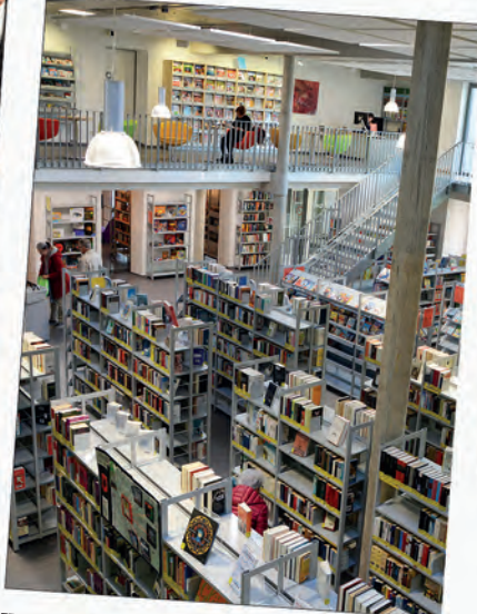
KULT. Kulturzentrum: Stadtbibliothek gewinnt im ersten Jahr viele neue Leser