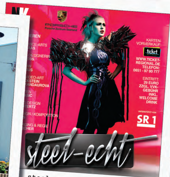
steel-echt Fashionshow: Internationales Design präsentierte sich in der Neuen Gebläsehalle