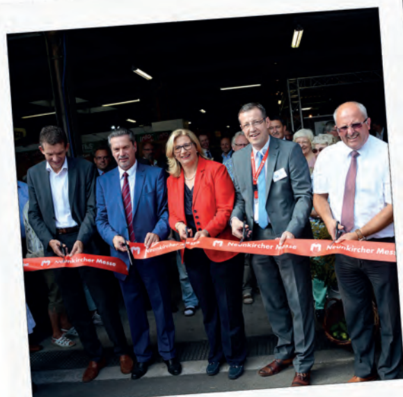
Neunkircher Messe 2016: Erfolgreiches Forum für Handel, Handwerk und Gewerbe in der Region