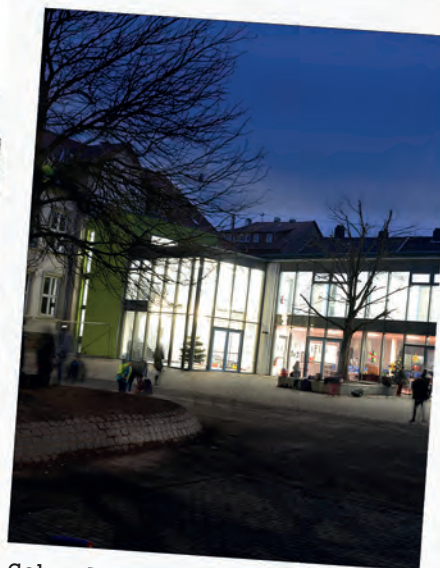
Gebundene Ganztagsgrundschule Am Stadtpark: Fertigstellung für Top-Betreuung