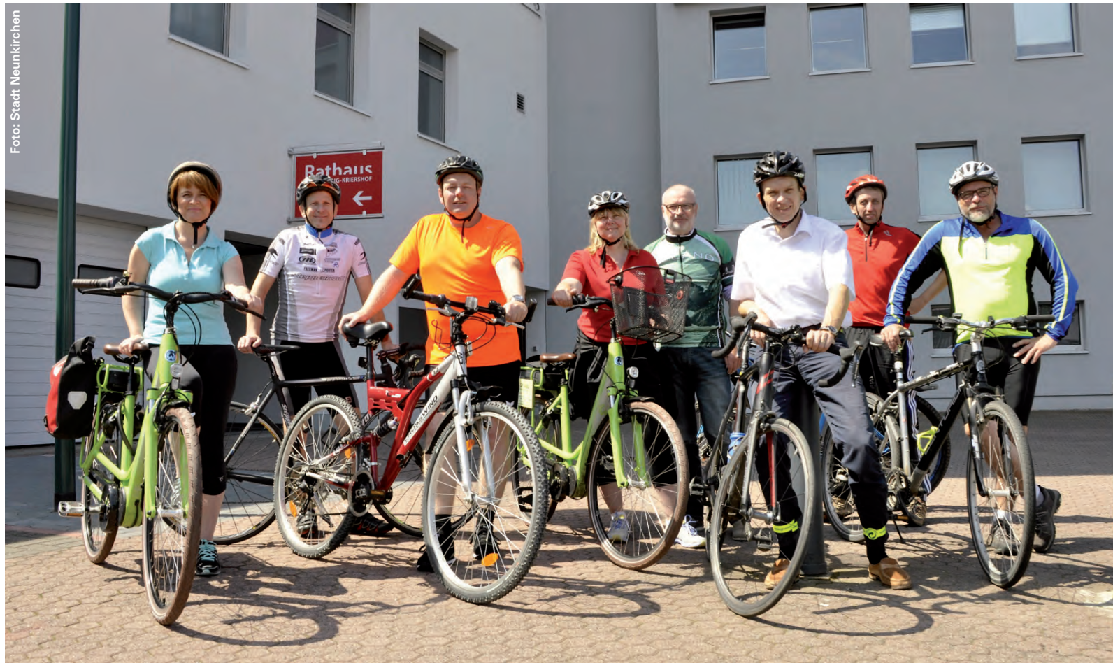
Die Stadtverwaltung beteiligt sich mit einem eigenen Team.

über Kohlhof, Limbach, Altstadt, Blieskastel (Streckenlänge 40 bis 70 km).