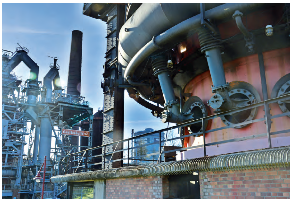
Auf den Spuren Stumms.