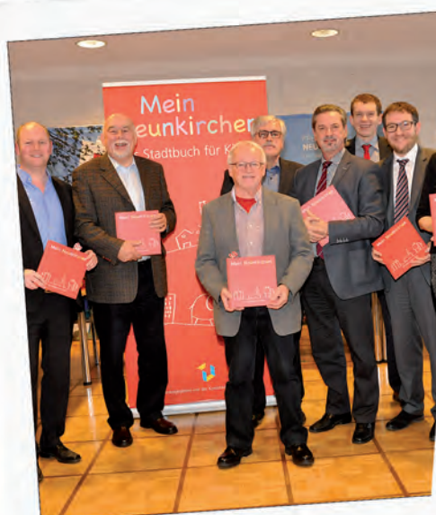
Mein Neunkircher: Einzigartiges Kinder-Stadtbuch veröffentlicht.