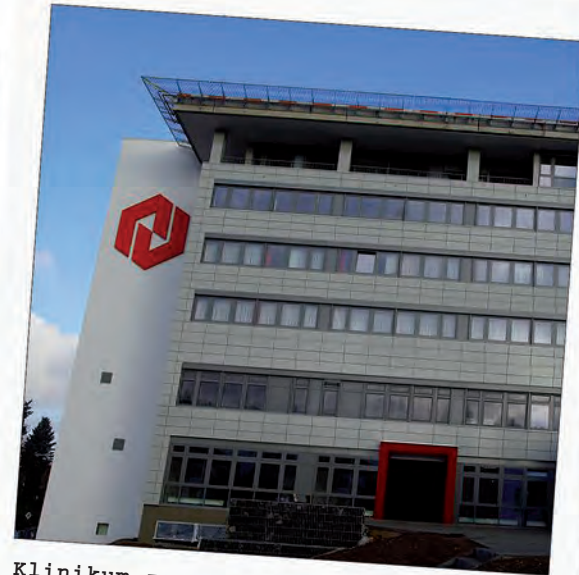
Klinikum zur Kreuzbacher Diakonie: Verkauf sichert Arbeitsplätze und Gesundheitsstandort.