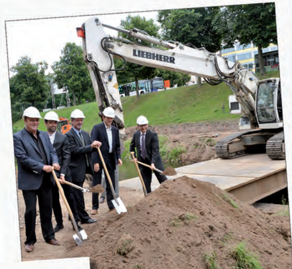
Bliesterrassen für Mehr Neunkirchen: Der erste Bauabschnitt ist gestartet.