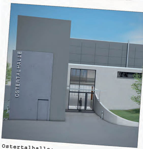
Ostertalhalle: Fortführung des Sanierungskonzeptes