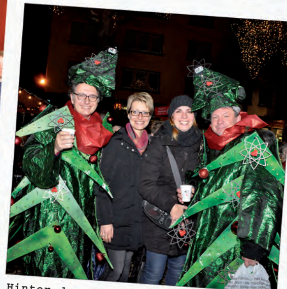
Hinter der Christuskirche: Neuer Weihnachtsmarkt am alten Platz kam sehr gut an.