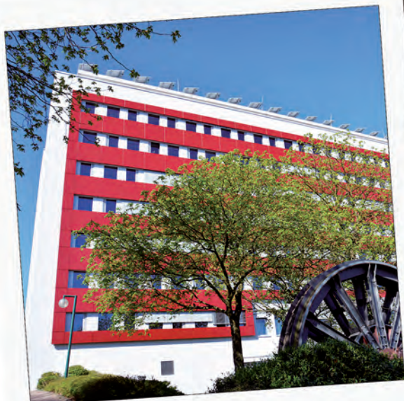
Rathaus: Neue Fassade mit Energiespareffekt umgesetzt.