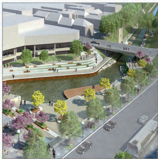
Neue Wohnungen für die City: Die ersten an Bliesterrassen und Unterer Markt werden fertig gestellt.