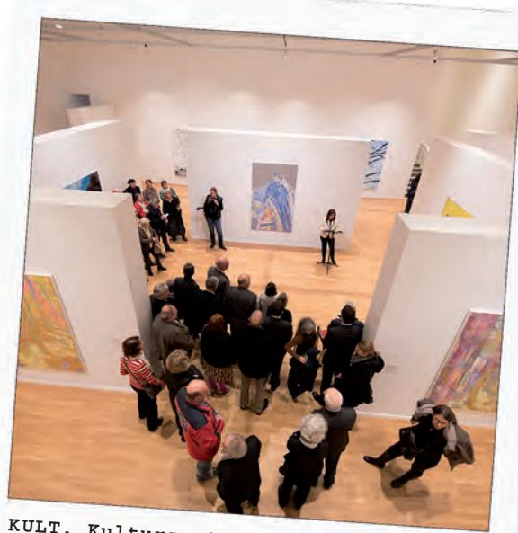
KULT. Kulturzentrum Neunkirchen: Neuer kultureller Anker für Neunkirchen im ehemaligen Bürgerhaus.