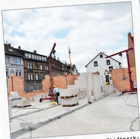
Gebundene Ganztagschule Am Stadtpark: Fertigstellung für Top-Betreuung.