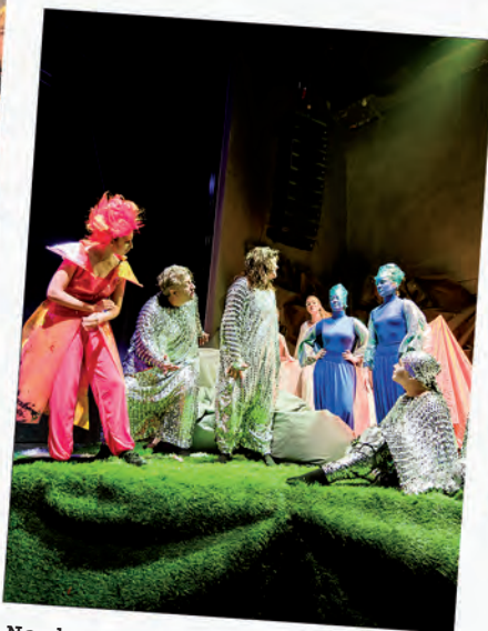
Nach erfolgreicher Wiederaufnahme: „Steam“ präsentiert Musical bei Bürgerfest des Saarlandes.