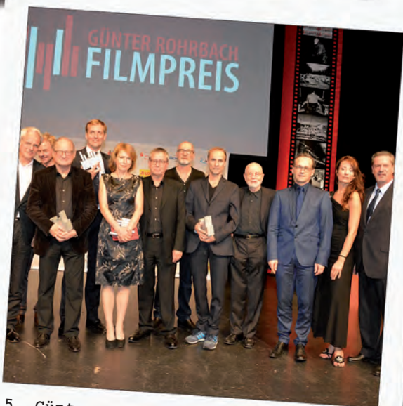
5. Günter Rohrbach Filmpreis: Neunkirchen etabliert sich weiter als Filmstadt.