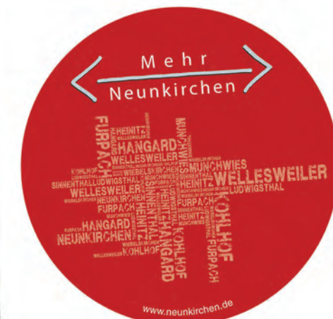
Mehr Neunkirchen: Neuer Imagefilm wird vorgestellt.