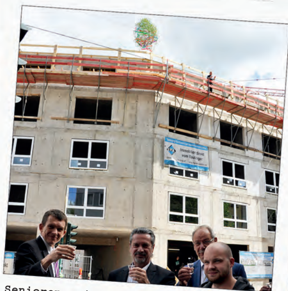
Seniorenresidenz in der Bahnhofstraße Fertigstellung und Eröffnung.