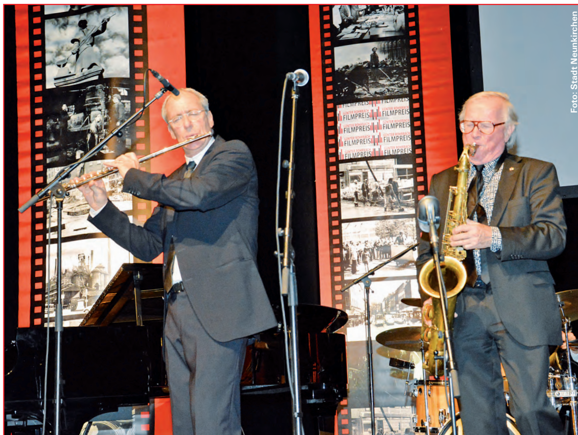
Einmalig: August Zirner und Klaus Doldinger jazzten gemeinsam auf der Bühne.