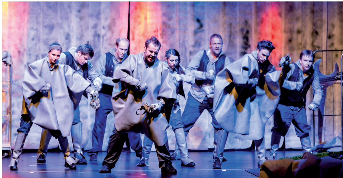
STEAM macht Dampf am Staatstheater