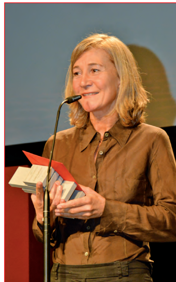
Kamerafrau Judith Kaufmann