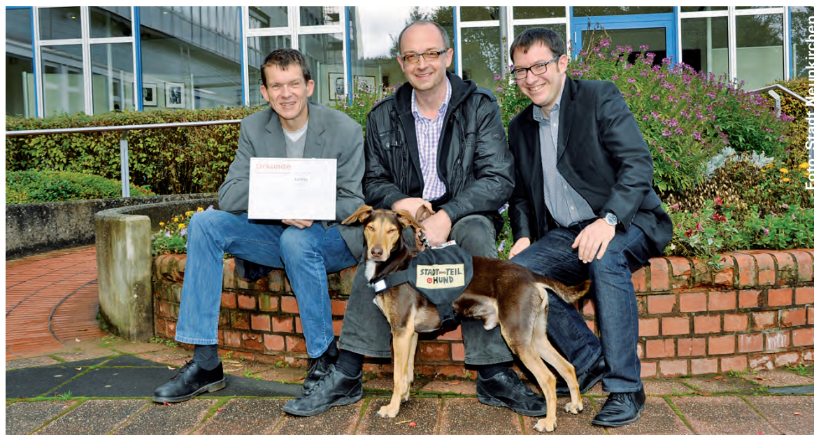
Für mehr Sauberkeit: Auf den Hund gekommen.

Hundekot im öffentlichen Raum ist ein leidiges Thema. Zwar gibt es Hundekotbeutel, doch manchen Hundehaltern ist es schlicht egal, wo ihr Hund hinmacht. Aus Sicht mancher Bürger soll es der Ordnungsdienst richten. „Doch rücksichtslosen Hundehaltern auf den Pelz zu rücken, ist nicht die Haupt-