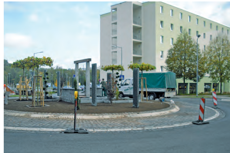
Schönes „auf den Kreis“ gebracht.

sai Formgehölzen und Fächer-Ahorn Solitär Pflanzen eine ansprechende Begrünung. In der Kreismitte wurde ein Querbalken aus Holz auf zwei Granitstelen aufgelegt und mit einem Rankgitter aus Edelstahl bespannt um einem Kletterrosen Solitär halt zu geben. Die Kosten für diese Baumaßnahme belaufen sich auf ca. 25.000 €.