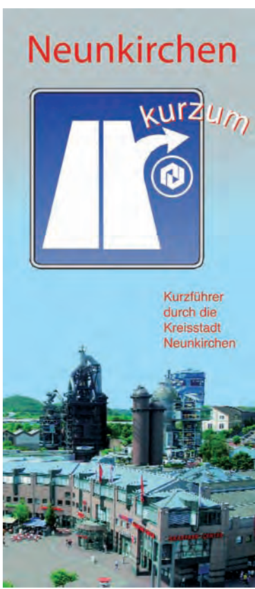
Kurzführer durch die Kreisstadt Neunkirchen