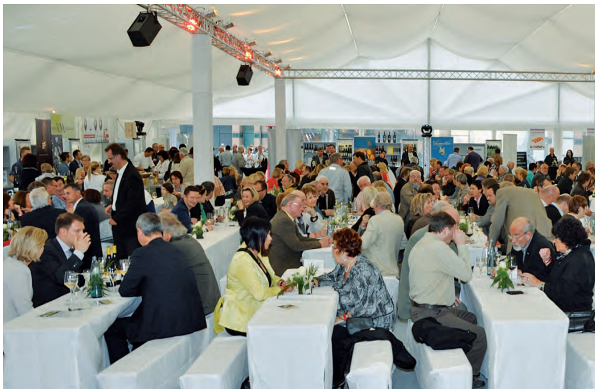
Genuss pur erlebten die zahlreichen Besucher der Neunkircher Weinlounge.