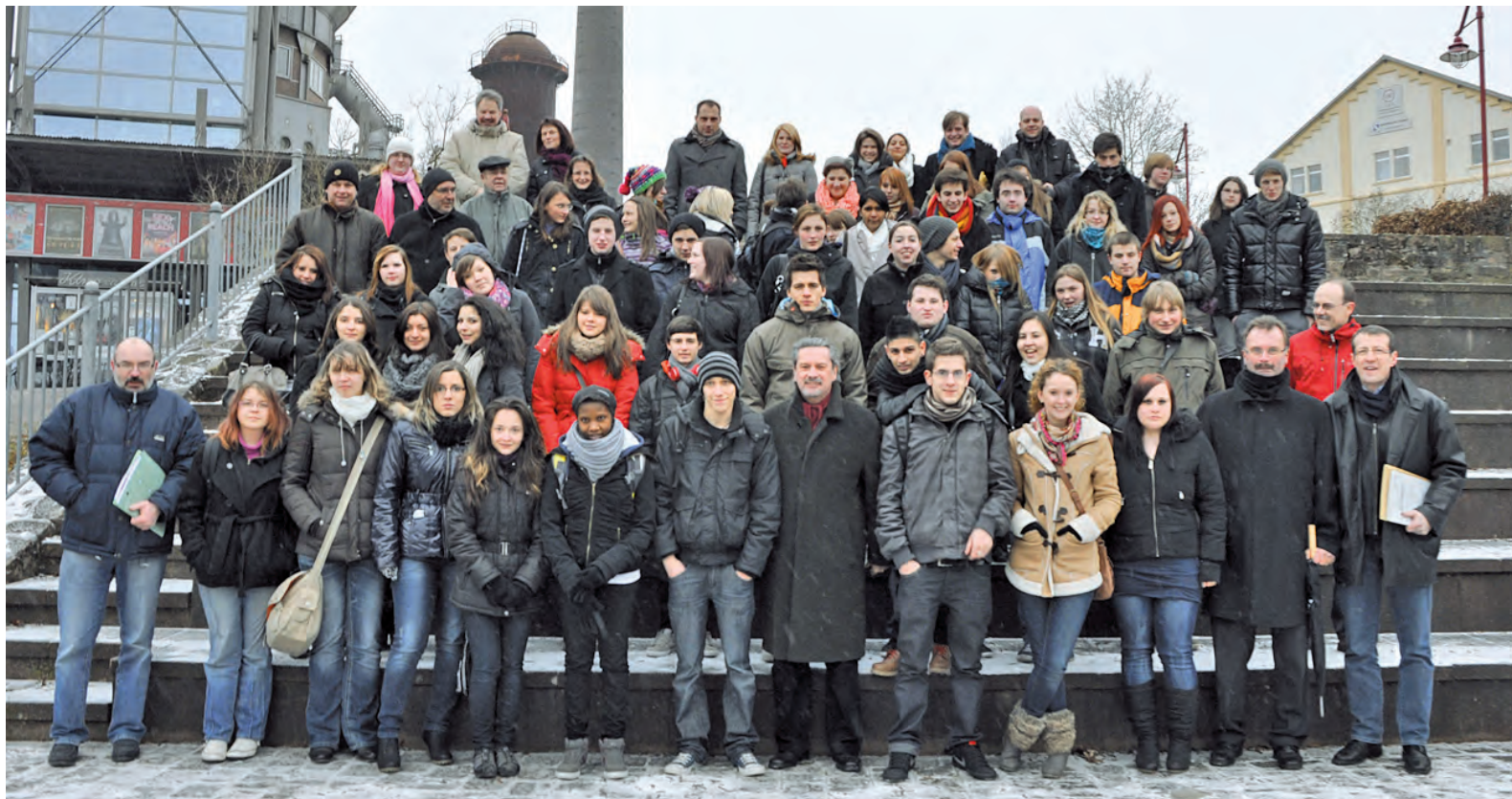
Rund 50 Berufsstarter informierten sich über Abläufe in verschiedenen Betrieben.

Die Teilnehmer erhielten das Zukunftsdiplom, welches durchaus auch eine interessante Ergänzung der Bewerbungsunterlagen ist. Oberbürgermeister Jürgen Fried kündigte aufgrund der sehr guten Resonanz eine Weiterführung des Projektes in diesem Jahr an.