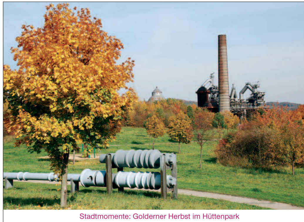
Stadtmomente: Goldener Herbst im Hüttenpark

Präsentkorb, gratulierten herzlich. Zu den Gratulanten in der Kleiststraße gehörte auch die in Schottland lebende Tochter mit Enkel, die extra zum Geburtstag angereist waren.