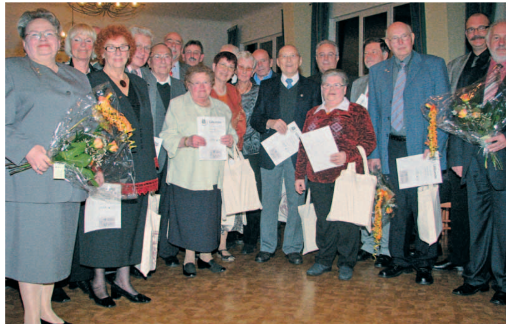
25 Jahre für Partnerschaft der Städte aktiv: die Gründungsmitglieder