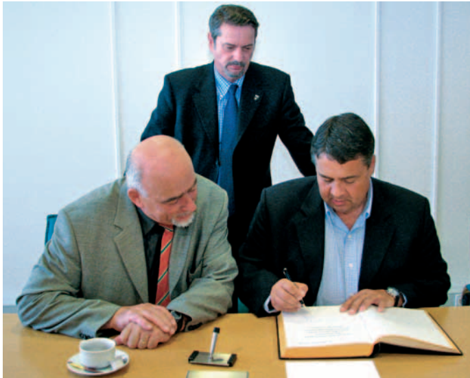
Umweltminister Gabriel trug sich ins Goldene Buch der Stadt

naturierung der ehemaligen Hüften- und Bergwerksflächen sehr gut erkennen kann.