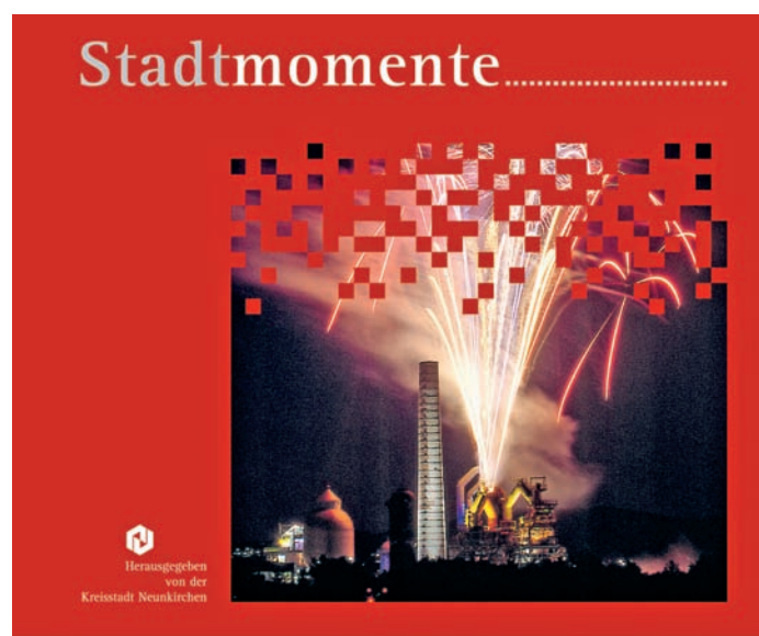
Das Titelbild des neuen Buches

Die Kreisstadt Neunkirchen hat einen neuen Bildband über Neunkirchen herausgegeben. Die Bilder von Hans Huwer und Monika Vomwalde fangen Situationen und Stimmungen - „Stadtmomente“ eben - ein. Der durch seine langjährige Tätigkeit bei der Saarbrücker Zeitung bekannte Chronist Gerd Meiser hat dazu lyrisch-launische Texte verfasst. Das