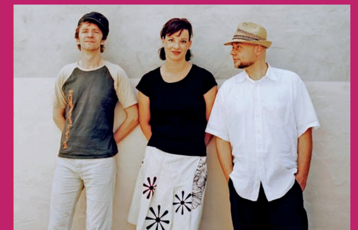
Münchner Lach- und Schiessgesellschaft

Vorverkauf für alle Veranstaltungen: bei allen CTS-Vorverkaufsstellen (z.B. Wochenspiegel und Saarbrücker Zeitung) In Neunkirchen: Klein Buch & Papier, Bücher König, NVG-Pavillon, Tabak Etelbrück, Tabak Sauerchnig Ticketothline (0681) 588 2222