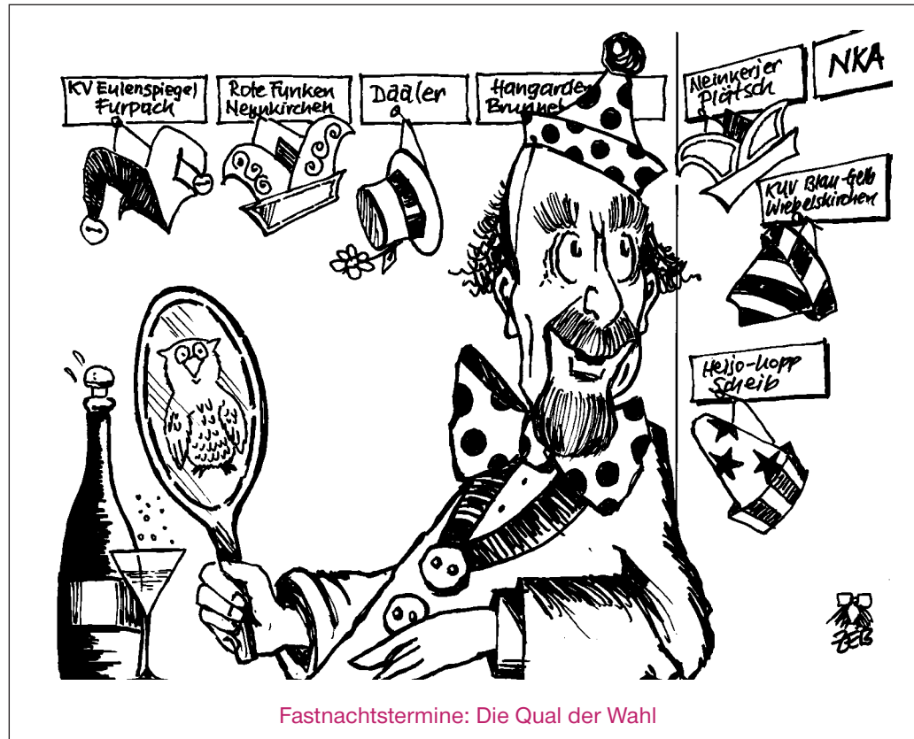
Fastnachtstermine: Die Qual der Wahl

Buch erfreut sich großer Nachfrage: Schon über 200 Exemplare der in einer Handlungsaufgabe von 1000 Stück von der Ottweiler Druckerei und Verlag produzierten Publikation sind über den Ladentisch gegangen. Das gebundene Buch mit 104 Seiten und rund 100 farbigen Abbildungen ist im örtlichen Buchhandel zum Preis von 19,90 Euro erhältlich.