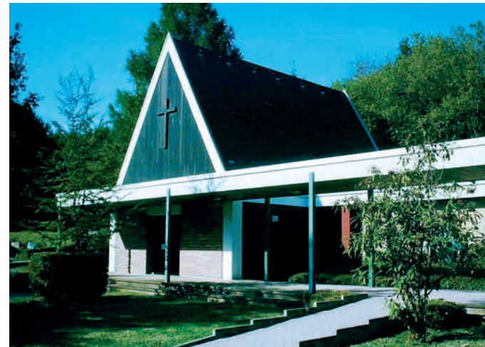
Die Einsegnungshalle in Münchwies

Friedhof wurden schon ein Jahr später miteinander verbunden. Eine moderne Leichenhalle wurde 1971 eingeweiht. In jüngster Zeit wurde der Friedhof wiederum erweitert. Der Friedhof ist etwa 1,1 Hektar groß. Interessant ist das alte Sandsteinkreuz vor der modernen Leichenhalle. Es trägt am Sockel die Inschrift: „In deine Hände empfehle ich meinen Geist; Du hast mich erlöst o Herr Du Gott der Wahrheit Psalm 30,6 Er richtet 1888“. Ein weiterer Spruch ist auf einer Gittertür zu finden, die neben den griechischen Buchstaben Alpha und Omega die Inschrift trägt: „Der Tod ist das Tor zum Leben“. In einem atriumartigen Innenhof der Leichenhalle ist auch ein Ehrenmal für die Toten der beiden Weltkriege.