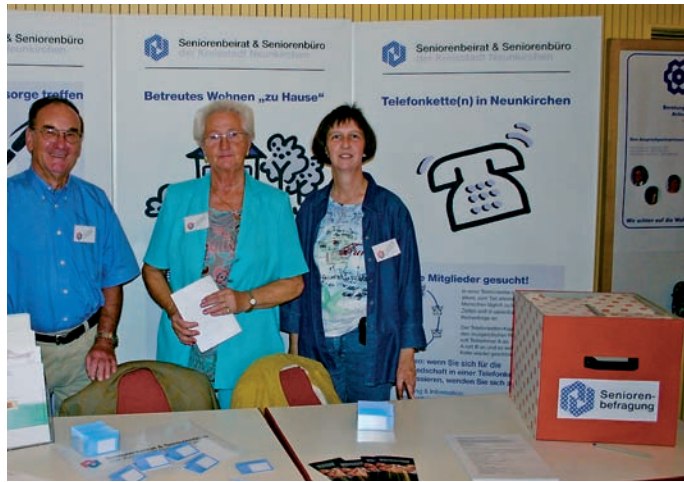
Am 29. September 2006 wurde die Fragebogenaktion gestartet