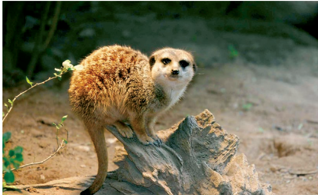
Willst Du vielleicht mein Pate werden?...