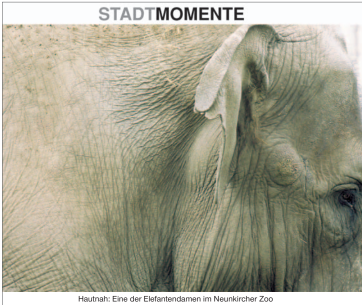
Hautnah: Eine der Elefantentümer im Neunkircher Zoo

taste am Parkscheinautomaten erhält man einen kostenlosen Parkschein. Das Parken für eine halbe Stunde kostet nur 20 Cent, jede weitere zehn Minuten 10 Cent. Für den gemütlichen „Bummel“ bieten sich die Parkplätze „Hochhofen“ bzw. „Wellewiler-Straße“ an. Hier kann für zwei Euro bis zu zwölf Stunden geparkt werden. Wer sich nicht auf eine bestimmte Verweildauer festlegen will, sollte das Handy zum Bezahlen der Parkgebühren nutzen. Hierbei erfolgt die Abrechnung minutengenau anhand der tatsächlich in Anspruch genommenen Parkzeit. Für dieses zum 31. Dezember befristete Pilotprojekt kann man sich per Internet ( www.schlauen-parken.de ) oder Call-Center anmelden. Die Telefonnummern sind in den einzelnen Parkzonen beschildert. Neben den zu zahlenden Parkgebühren kommen dabei keine zusätzlichen Kosten auf den Handyparker zu. Dieses System kann man auch in Saarbrücken und in Wiesbaden nutzen. Dieser einzigartige Mix aus gebührenfreiem und kostengünstigem Parkplatzangebot in der City macht das besondere Flair eines Einkaufsummels in Neunkirchen erst zum Genuss.